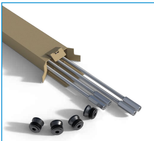
4 x M12 x 1m

Wenn Ihr Schornstein mehr als 1,5m über das Hausdach übersteht, muss dieser entsprechend Verstärkt werden, dieses machen Sie mit dem Hoch Bewährungsset. Jedoch ist hierzu eine Berechnung der Statik mit Hilfe der Speziellen Software KESA ALADIN erforderlich.